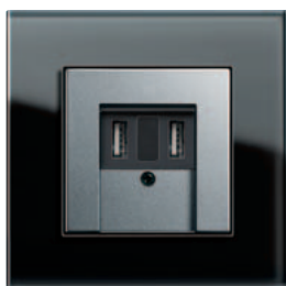
Alimentation USB Gira, double, Gira Esprit, verre noir/teinte alu