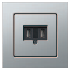
Alimentation USB Gira, double Gira E22, aluminium

Vous trouverez des informations complémentaires dans le catalogue Gira ainsi que sur l'internet sous www.gira.be