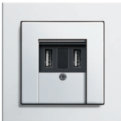
Alimentation USB Gira, double Gira E2, blanc brillant